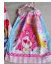
タオルエプロン(例)