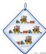
手拭きタオル ループ付(例)

★汚れ物を入れる手付きビニール袋(スーパー袋でも可) 3枚 (手付きビニール袋にも1枚ずつ記名をお願いします)